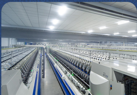
四川帛宇绿色生态智能纺纱项目