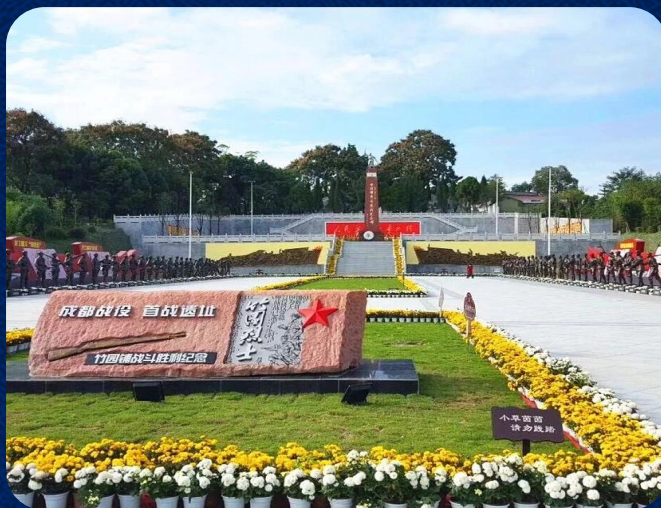
成都战役·首战遗址